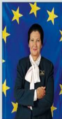
Simone Veil et le drapeau européen

Simone Veil est une championne de l'Europe unie et des droits de la femme. Pendant la Deuxième Guerre Mondiale, elle est déportée dans un camp de concentration nazi. Après la guerre, elle fait de brillantes études de droit et de sciences politiques. À l'âge de 20 ans, elle devient attachée auprès du Ministre de la Justice. De 1974 à 1979, elle est nommée Ministre de la Santé. En 1979, elle est élue Député au Parlement européen et elle en est la première présidente.